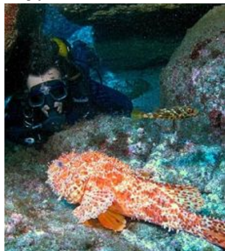
A região é muito procurada devido a sua diversidade marinha.

Pela conservação privilegiada de um ecossistema único , o ecoturismo , especialmente o mergulho , é um dos principais atrativos do arquipélago dos Açores . As paisagens submarinas, com seus declives acentuados e compostos de cavernas e arcadas, abrigam uma grande diversidade de fauna marinha , com algas, cardumes e peixes difíceis de se ver em outros lugares.